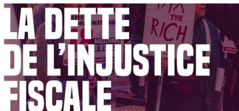
COMMENT LA DIMINUTION DES RECETTES PUBLIQUES ET LES CADEAUX FISCAUX ONT CREUSÉ LA DETTE ?